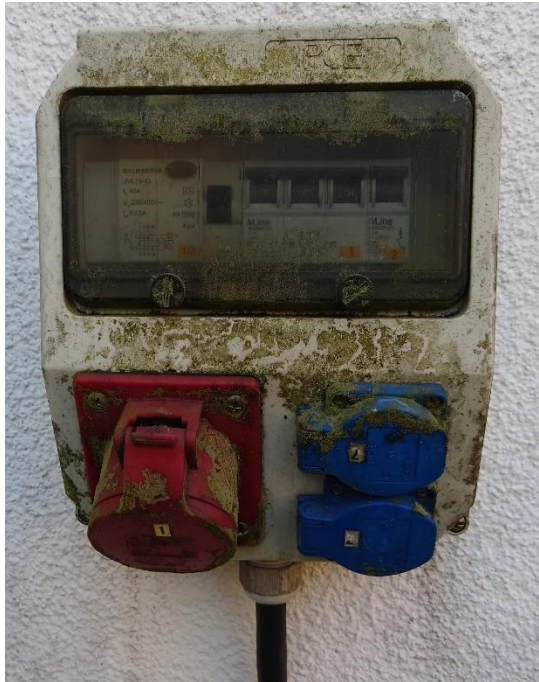
Huvudsäkring för hela elanläggningen 3x20 A.